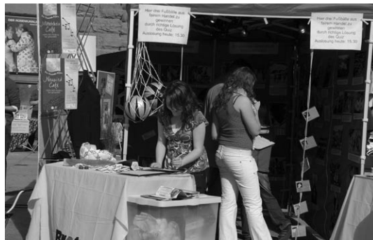
„Fairness - eine runde Sache“ Aktionsstand von Brot für die Welt im Zentrum Ökumene am Aktionstag in Mainz